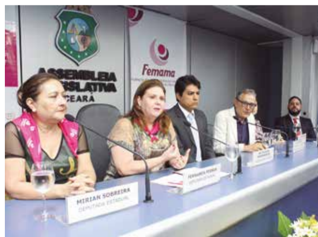
Debate na Frente Parlamentar em Defesa da Mulher

A Frente Parlamentar em Defesa da Mulher da Assembleia Legislativa promoveu no dia 23/05 o Ciclo de Debates sobre Câncer de Mama para Parlamentares. O evento reuniu médicos especialistas em câncer de mama e membros de associações de apoio às pacientes. O debate com o tema: "Câncer de Mama no Brasil: Por que não curamos mais?", foi mediado pela Federação Brasileira de Instituições Filantrópicas de Apoio à Saúde da Mama (Femama).