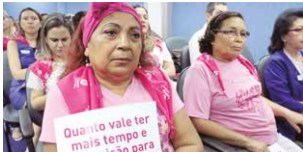
FRENTE DA MULHER PÁGINA 2

Celebração dos 20 anos incluiu reinauguração do equipamento modernizado