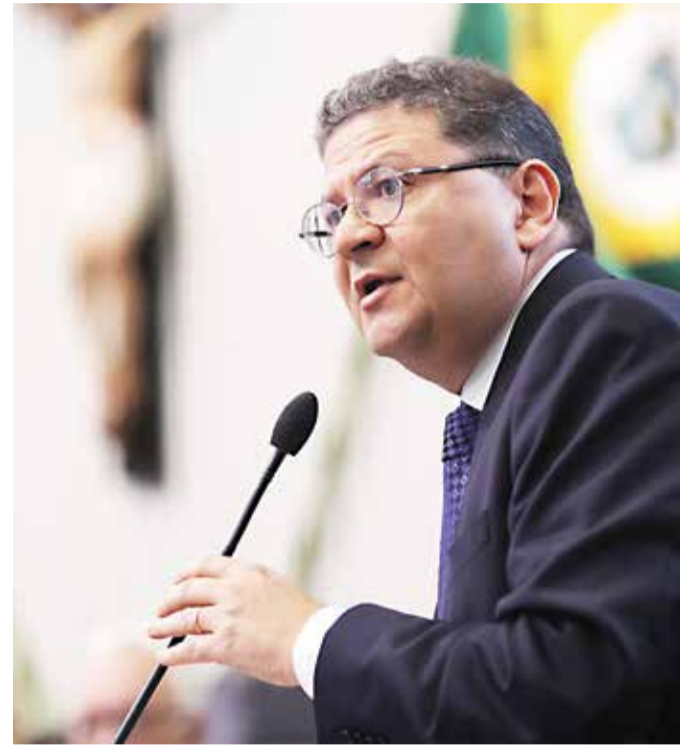
Secretário de Justiça, Hélio Leitão, apresenta ações aos deputados.