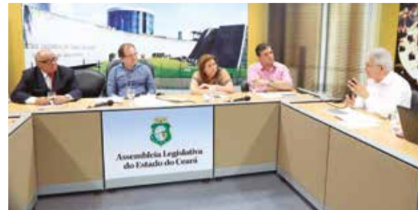
COMBATE A DENGUE PÁGINA 2

Ciclo de debates pede atenção do SUS a pacientes de câncer de mama