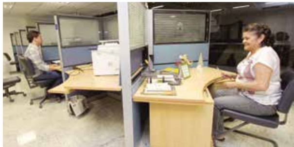
ESPAÇO DO POVO PÁGINA 4

Celebração dos 20 anos incluiu reinauguração do equipamento modernizado