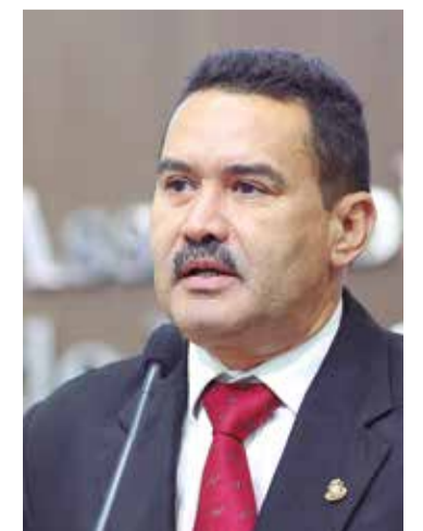
Deputado Moisés Braz (PT)