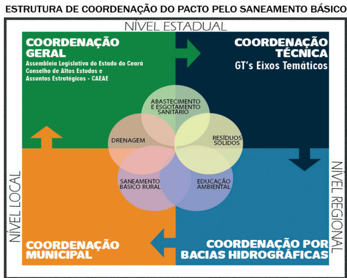
Figura I - Estrutura de Coordenação do Pacto pelo Saneamento Básico