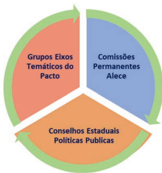
Figura II - Comissão de Monitoramento e Governança do Pacto pelo Saneamento Básico do Ceará

Considera-se ainda relevante a inserção na Comissão de Monitoramento e Governança do Pacto pelo Saneamento a representação dos órgãos colegiados, que têm como atribuição a coordenação das políticas públicas estaduais que se relacionam com os componentes do Saneamento Básico, quais sejam: Conselho Estadual de Meio Ambiente (Coema), Conselho Estadual das Cidades do Ceará (ConCidades/CE); Conselho Estadual de Recursos Hídricos do Ceará (Conerh) e Conselho Estadual de Desenvolvimento Rural (CEDR).