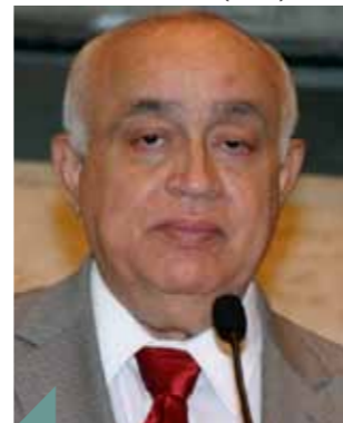
>> Professor Teodoro (PSDB)

O deputado Professor Teodoro (PSDB) apresentou projeto indicando ao Governo que os documentos de identificação civil sejam emitidos em 24 horas nos municípios cearenses com mais de 100 mil habitantes. Dessa forma, ele quer facilitar e garantir o acesso dos cidadãos aos serviços oferecidos pelo Estado, pois a existência do RG é condição fundamental para isso. O texto está em tramitação na AL.