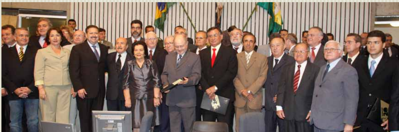
>> Presidente Domingos Filho (PMDB) com os deputados constituintes que elaboraram a Carta Magna de 1989.

A Assembleia Legislativa do Ceará realizou sessão solene em comemoração aos 20 anos de promulgação da Constituição de 1989 (dia 20/10), recebendo os parlamentares que participaram da elaboração da Carta Magna. O presidente Domingos Filho (PMDB) entregou à sociedade cearense na oportunidade, o texto recém atualizado. Ainda no mês de outubro, a Casa realizou sua segunda sessão itinerante de 2009, em Sobral.