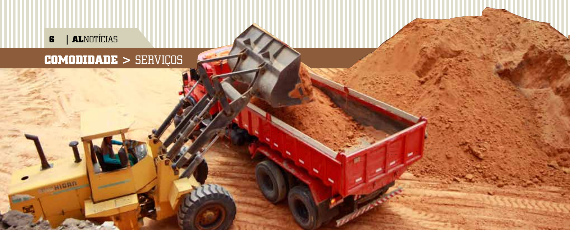
&gt;&gt; Início da escavação do terreno onde será construído o Anexo II.