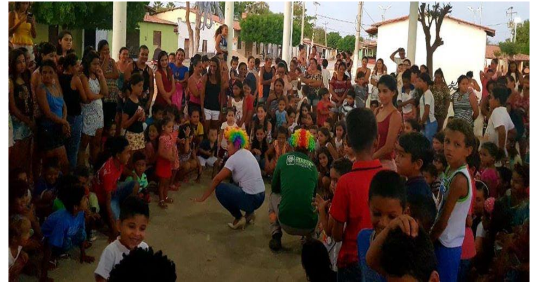
Conhecendo meu Sistema