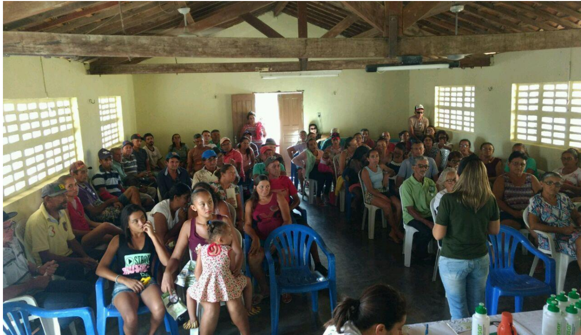
Reunião de Acompanhamento